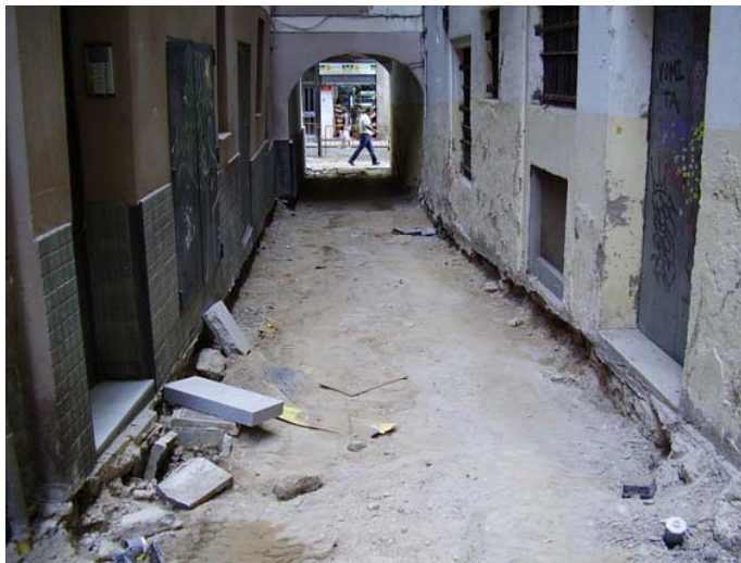
Vista de l'inici del Carrer Volta dels Jueus un cop enretirats el paviment anterior i el seu ferm.

Els treballs de l'obra, doncs, consistiren només en la retirada del paviment antic, format per llambordes de pedra, i del seu ferm, consistent en una capa de formigó de 10 a 15 cm. de gruix on es recolzaven les llambordes. Aquests treballs s'efectuaren de forma mecànica amb una Bobcat.