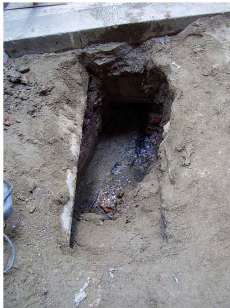
Vista general de la rasa 14

- Rasa 14: situada enfront de l'entrada al carrer dels Ocells. Es va realitzar per substituir la claveguera núm. 14. Té forma rectangular, amb 1,40 metres de llarg, 80 cm. d'ample i una profunditat que va dels 1,05 m a 1,35 metres, arribant a una cota màxima de 5,15 metres sobre el nivell del mar. Segueix la direcció sud-est / nord-oest. No s'ha localitzat cap element arqueològic.