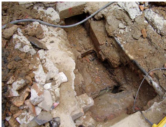
Vista general de la rasa 3

-Rasa 3: situada entre la vivenda Núm. 3 i la vivenda Núm. 5 del carrer Cortines, correspon a la substitució de la claveguera núm. 3. Té forma quasi triangular, amb una llargada de 2 metres, una amplada que varia dels 60 cm a 1,25 metres i una profunditat que va dels 70 cm als 1,30 metres, arribant a una cota màxima de 4,50 metres sobre el nivell del mar. Segueix la direcció sud-est / nord-est i no s'ha localitzat cap resta de interès.