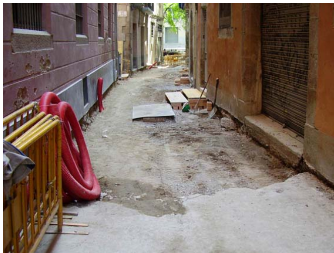
Vista de l'inici del carrer Cortines durant el procés d'enretirada del ferm del paviment anterior

Els treballs de l'obra van començar amb la retirada del paviment antic, format per llambordes de pedra, i del seu ferm, consistent en una capa de formigó de 10 a 15 cm. de gruix on es recolzaven les llambordes. Aquests treballs s'efectuaren de forma mecànica amb una Bobcat.