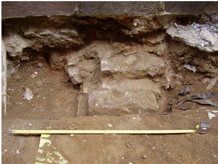
Vista de l'estructura arqueològica localitzada a la rasa 19, interpretada com les restes d'una possible claveguera antiga

amb pedra i totxo lligats amb morter i s'ha interpretat com part d'una claveguera antiga, encara que no podem determinar la seva cronologia degut a que no s'ha pogut excavar l'estratigrafia associada. Segueix la direcció sud-est / nord-oest i fa uns 35 cm. de llarg, 55cm. d'ample i està situada a uns 35 cm. del paviment del carrer, a una cota de 5,55 m. sobre el nivell del mar. Sobre la claveguera recolza el mur d'una façana actual i la continuació cap a l'altra banda s'hauria destruït degut a la col·locació dels serveis del carrer. De totes maneres no hem documentat exhaustivament aquesta estructura a causa que no quedava afectada pels treballs de l'obra.